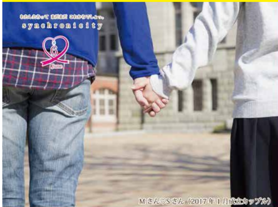
Mさん♡Sさん (2017年1月成立カップル)

「世代別」・「少人数」の登録制 カップリング。 プライバシー重視の「オトナの出逢い」を演出します。